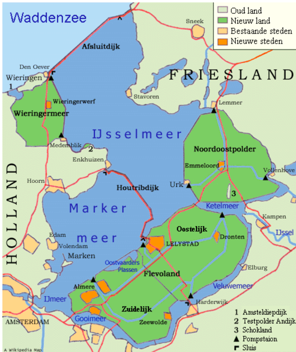
Figuur 1 De IJsselmeerpolders

Het is dit jaar 75 jaar geleden dat de Noord Oost Polder werd drooggelegd. De voorbereidende werkzaamheden waren al in de jaren Dertig van de vorige Eeuw gedaan maar de inpoldering werd afgemaakt in 1942, tijdens de Duitse bezetting