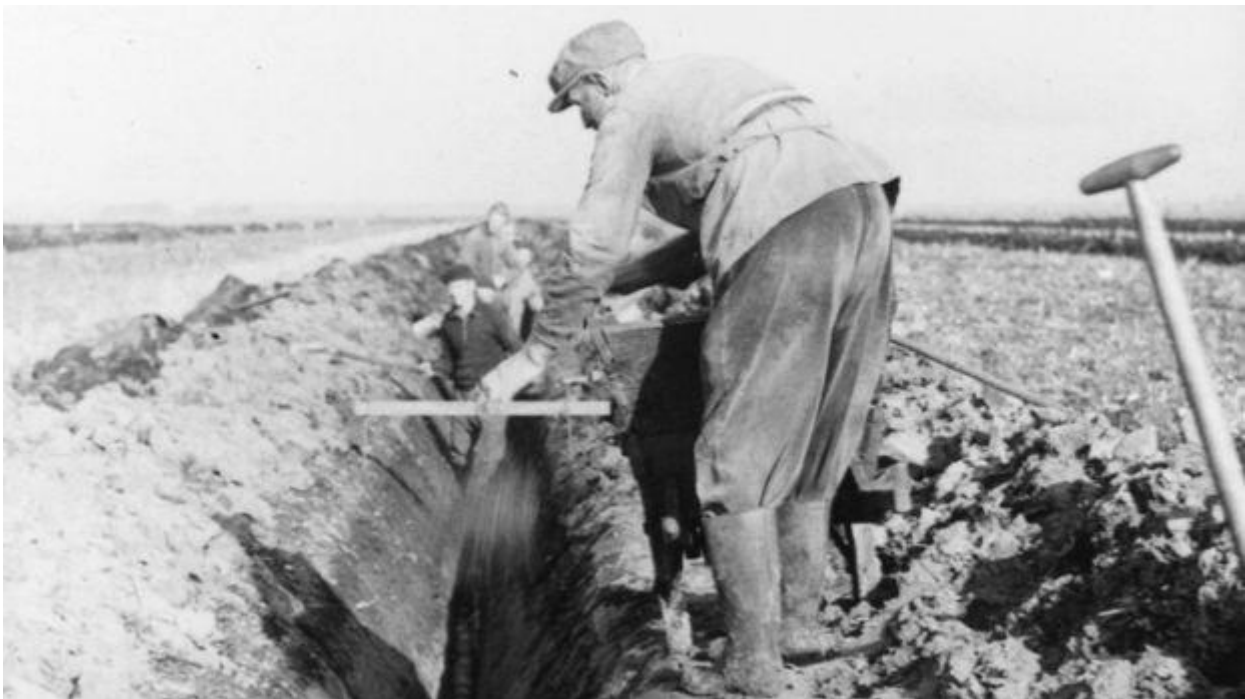
Figuur 3 De eerste bewoners van de NOP graven geulen voor de afwatering in de polder

Geo-bronnen, september 2017, auteur r Gotze Kalsbeekdecember